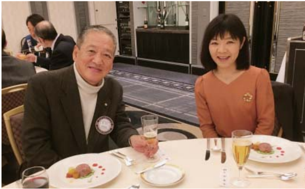
瀧幹事・水庫会長エレクト