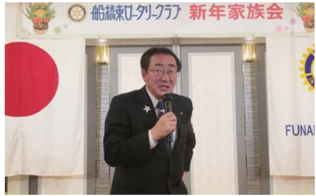
金子東京中央 RC 会員スピーチ