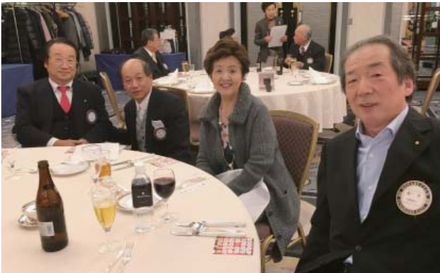
相澤会員・夫人・度会・織戸会員